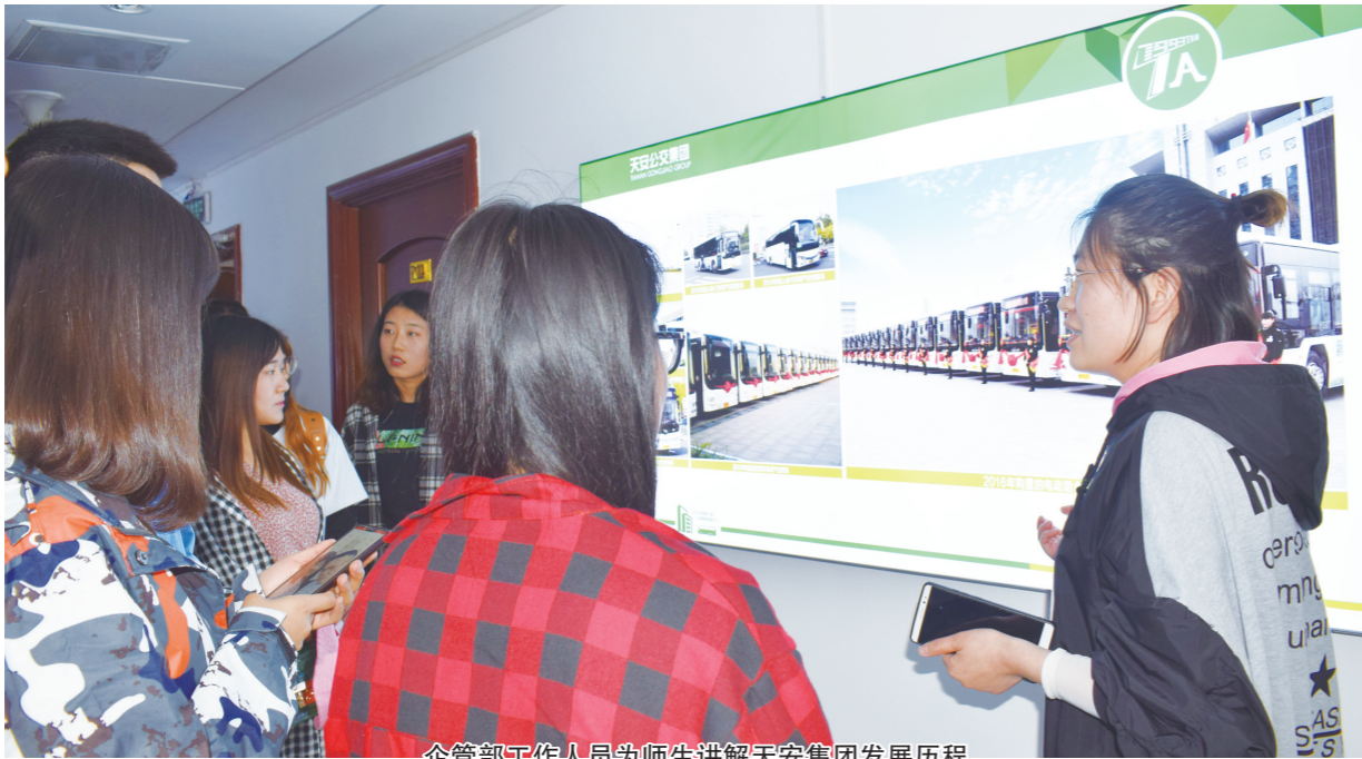
企管部工作人员为师生讲解天安集团发展历程

参观学习结束后,带队老师感谢天安公交集团能够提供这样的学习实践机会,希望今后能进一步加强校企合作。